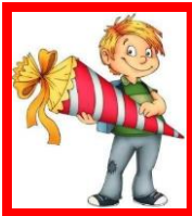
Ich bin ein Maxi

Im besonderen letzten Jahr vor dem Schuleintritt begleiten wir die Kinder mit dem Projekt „Maxi-Gruppe“ in dem viele Angebote zu verschiedenen Themen angeboten werden, um den Erfahrungshorizont der Kinder zu erweitern: