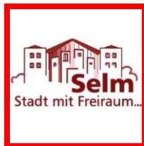
Meine Stadt Selm